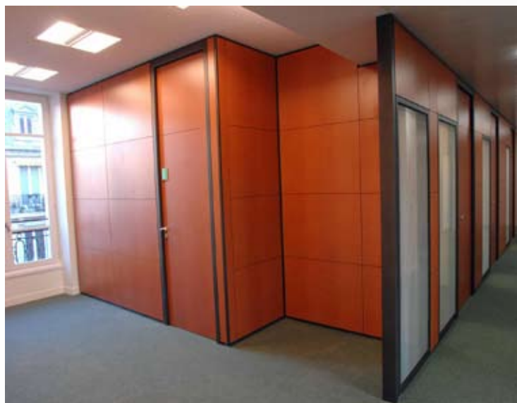
Clipsarmonie, double vitrage avec imposte pleine et porte bois à imposte filante