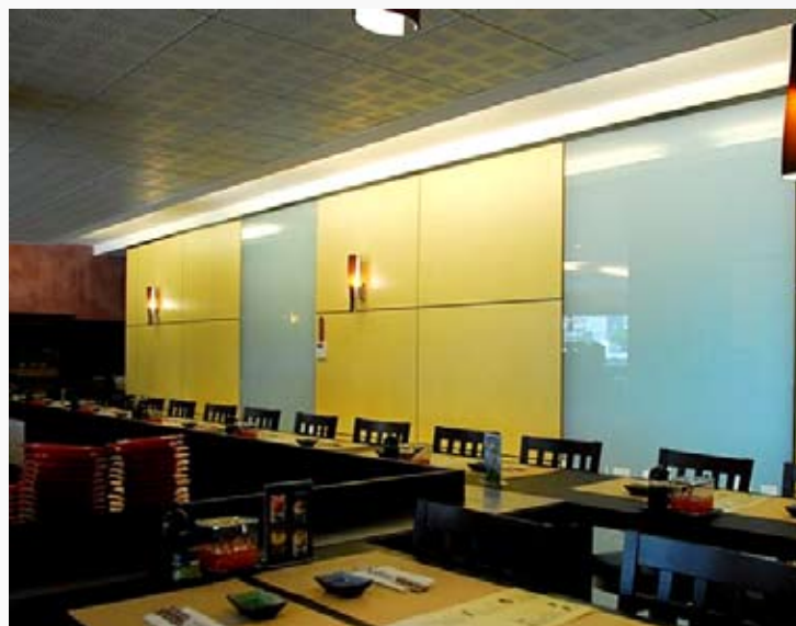
Clipsarmonie à joints creux, avec vitrage sablé toute hauteur et panneaux mélaminés