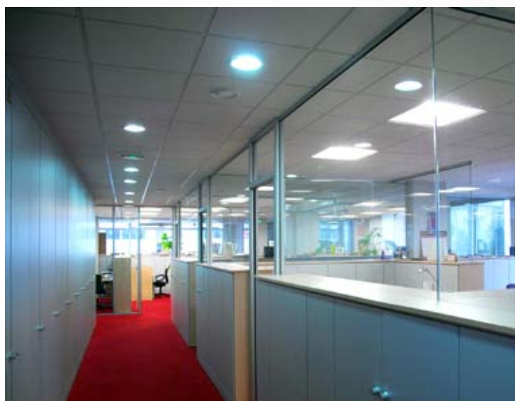
Clipsoplaque sur placard séparatif, vitrage bord à bord collé